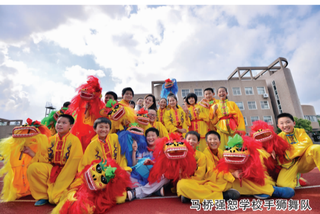
马桥强恕学校手狮舞队