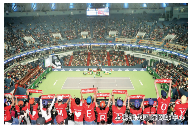
上海旗忠国际网球中心