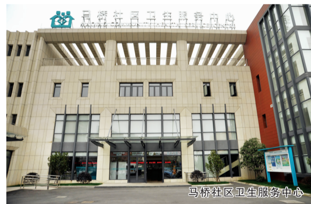
马桥社区卫生服务中心