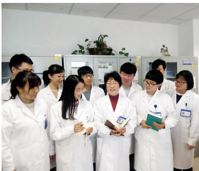
马桥公共卫生中心团队

中心有效落实各项防控措施,积极做好冬春季呼吸道传染病和夏季肠道传染病的防控工作,及时控制暴发苗头。2017年共处置聚集性疫情13起。为提高卫生应急能力,中心不断完善卫生应急预案体系、工作制度、队伍建设以及物资保障等工作,开展卫生应急演练和人员培训,提升卫生应急队伍能力。