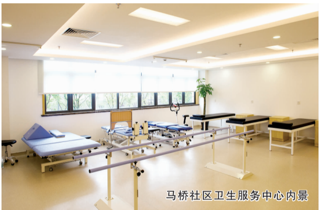
马桥社区卫生服务中心内景