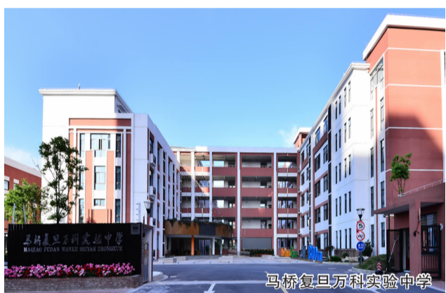
马桥复旦万科实验中学