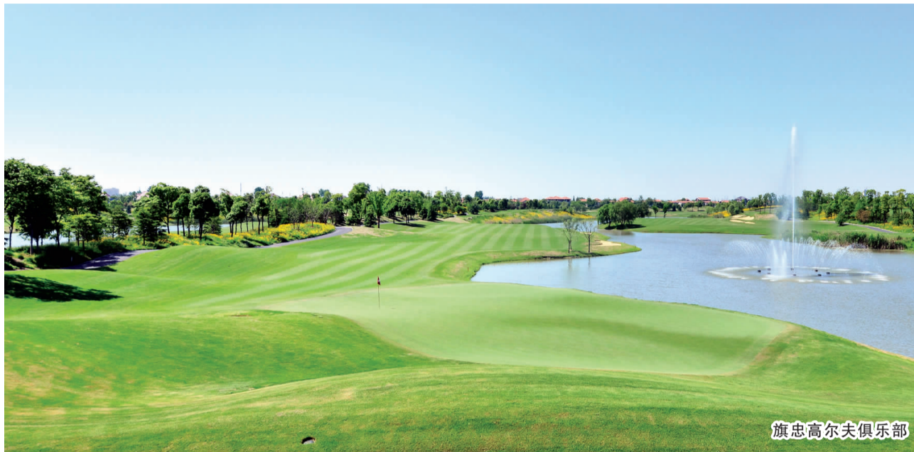
旗忠高尔夫俱乐部

就诊不再先往三级医院跑,转诊享受“绿色通道”,延伸处方让居民取药变得更便利更实惠……近年来马桥社区卫生服务中心不断深化社区卫生服务综合改革,扎实推进医疗联合体建设,通过建立与华山医院、儿科医院、市五医院、区牙防所、肿瘤医院的紧密合作关系,拓展服务内涵,打通“双向转